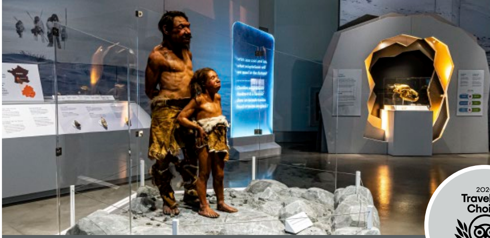
Special Exhibition (summer 2022): Planet Ice: Mysteries of the Ice Ages